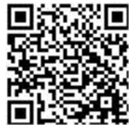
表 17 (续)